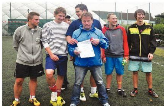
Vítězná družstvo MŠEZ3 se svým třídním učitelem.