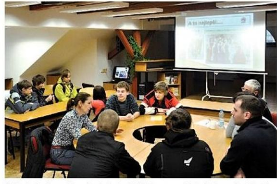
V učebně rekonstruovaného podkrovní se budoucí žáci školy seznámili mimo jiné se sportovními a kulturními aktivitami.

Šumperská Střední škola železniční a stavební vede své žáky od prvního ročníku k samostatnosti. Ukazuje jim, jak je důležité umět uplatnit na trhu práce své získávané vědomosti a dovednosti; dokázat je úspěšně „prodat“ na správném místě a v potřebném okamžik.