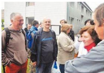
Hned ráno se sešli učitelé a žáci SŠŽS na Tyršově stadionu.

Poslední okamžiky školního roku sice už skončily, ale nemusi být na škodu ohlednout se na některými z nich. Žáci a učitelé Střední školy zelezníční a stavební v Šumperku mají k tomu svůj důvod. Než se rozšíří na prázdniny, zavítali na Tyršův stadion, aby se trochu rozcvičili, zavečerali si a zahráli. Se školním rokem se loučili tradičně – Sportovním dnem.