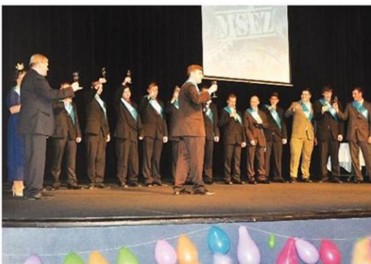
Slavnostní přípitek budoucích strojaři a mechaniků.