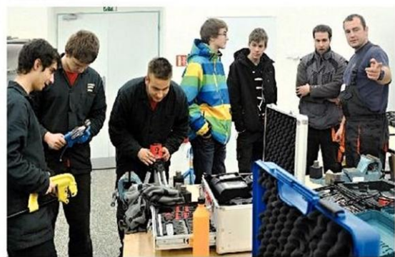
Nezávno modernizovaná dílna mladých instalatérů nešla pozornosti zájemců o vzdělávání ve Střední škole železniční a stavební v Šumperku.

A ještě něco: žáci se postupně učí spolupracovat se zejména na sebe a své vzdělání i a komunikační schopnosti. Maturitní vysvědčení nebo výuční list jsou jen potřebným startem a předpokladem k tomu, aby se dobře a včas uplatnili ve svém životě.