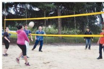
Plážový volejbal s písekem, ale bez sluníčka.