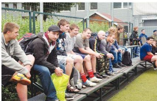
Diváci vše pozorně sledují a fandí!