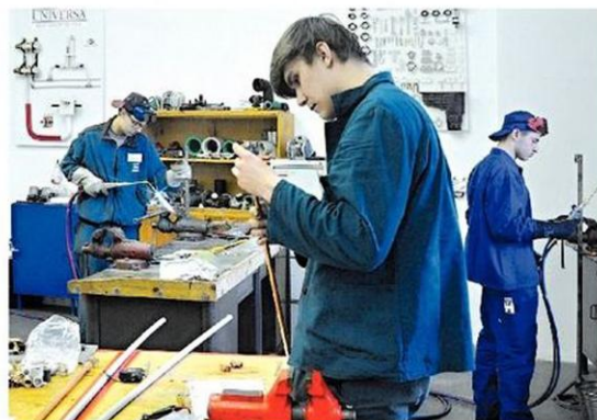
Soutěže se zúčastnilo dvanáct žáků z šesti okresů Olomouckého kraje.