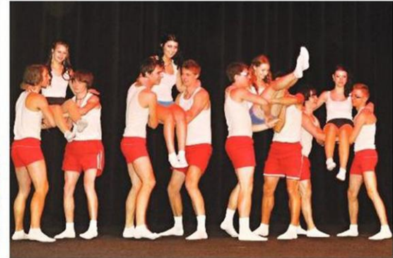
Velký potlesk sklidilo originální spartakiádní vystoupení stavaři S4, kteří svůj sportovní výkon bráň téměř vážně.

Poupata na spartakiádní stadiony. Recesi vyzbrojení stavaři třídy S4 předvedli ve svých slušivých sportovních úbořech, tradičních červených trenýrkách a bílých tilkách, písbovitou spartakiádní variaci. Poctivě cvičili, chvílemi tancovali, snaživě zápasili s ladným pohybem a nad-