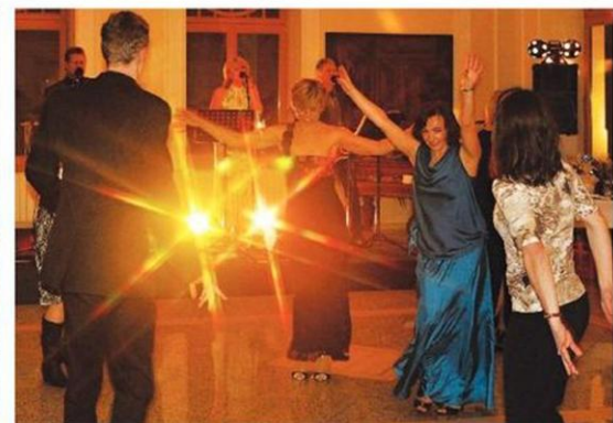
Program večera je naplněn. Nyní je čas k zábavě a plesání.