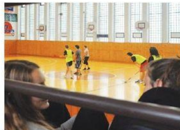
Tělocvičnu ovládl florbalistů.