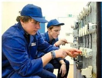
Malí elektrikáři ochotně předváděli ukázky svých praktických dovedností v nové dílně.