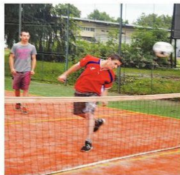
Nohejbal – míč se musí dostat přes síť.