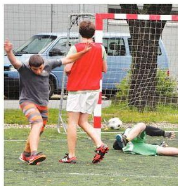
„Góóóó!“ zničí hřiště.