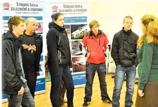
Prohlídka zámečkové areálu Střední školy železniční a stavební začala v aule.

Třetí lednovou středu netrpělivě zapisovali mnozí rodiče své děti do první třídy základní školy. Jini přijali pozvání a zavítali do Střední školy železniční a stavební v Šumperku. Využili nabídku Dne otevřených dveří, detailně si prohlédli budovu bývalého železničního zámku a důkladněji se seznámili s nabízenými obory vzdělání. Patří k nim tři zakončené maturitou a šest s výučním listem, se zaměřením zejména na stavitelství, strojírenství a tradiční řemesla.