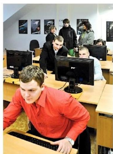
Žáci školy na Zámečku ukazovali zájemcům něco z toho, co se naučili v hodinách ICT na počítačích.