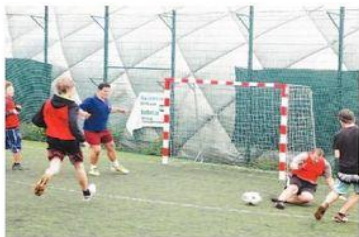
Bojovalo se o každý metr na hřišti.