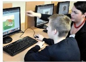
Mnozí žáci si hned u počítače vyzkoušeli práci s grafickými výukovými programy AutoCAD, ArchiCAD a Arlantis. Jak brzy zjistili, stavět domčky na počítači je docela zábavné.